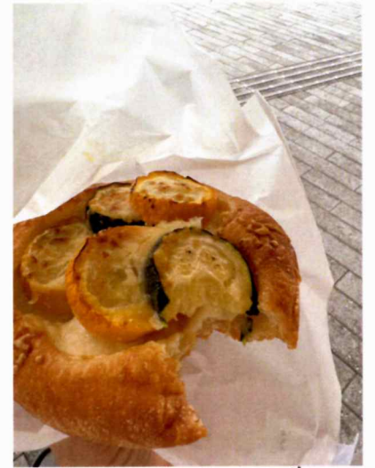
これは大好きなトセウタシリーズ!!