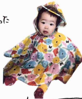
1才6ヶ月になりました

こんなひどい副鼻腔炎ははじめてで、6月はあつと、咳込み、鼻水が止まらず...。カラダは元気なのに、咳が止まらないうちに毎日と過ごししてありました...。免疫力を高めるのがこの最近の課題です!!